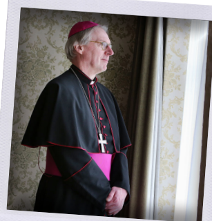
Bisschop de Korte

Kerstboodschap 2021, bisschop de Korte VERWONDERING IN EEN DONKERE TIJD